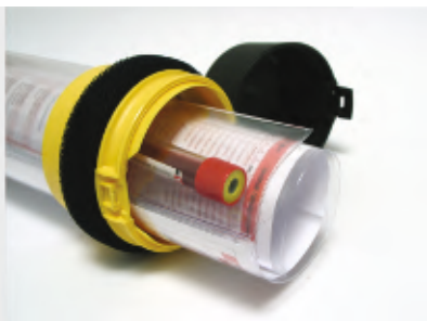
Różne inne materiały