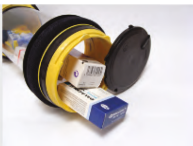
Leki, dawki jednostkowe „UNIT DOSE”