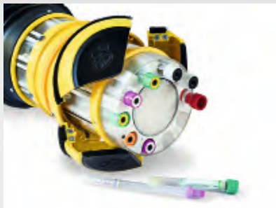
Różne typy probówek i producentów

Poczta pneumatyczna stanowi złożoną logistykę nowoczesnego szpitala i zapewnia zautomatyzowany transport przesyłek wszelkiego rodzaju próbek biologicznych (krwi, moczu, preparatów krwiopochodnych, cytostatyków, roztworów infuzyjnych, leków, dokumentacji, drobnego materiału itp.) w specjalnych pojemnikach transportowych na terenie całego szpitala pomiędzy oddziałami szpitalnymi, a laboratorium, apteką, sterylizacją, bankiem krwi.... uniwersalne rozwiązanie, które zastępuje osobiste przemieszczanie się!