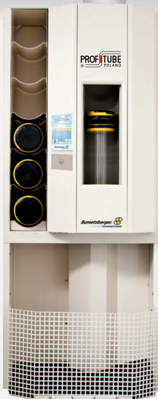
najnowocześniejsza stacja szpitalna na oddziale