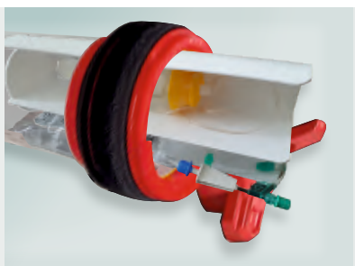
Cytostatyki w specjalnej wkładce