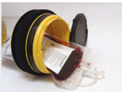
Preparaty transfuzyjne - osocze, krew